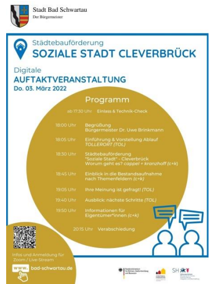
Abbildung 2: Programm-Plakat Auftaktveranstaltung