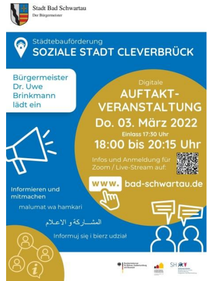
Abbildung 1: Plakat Auftaktveranstaltung (eigene Darstellung)

Mit der Erhebung und Verarbeitung ihrer Daten incl. der besonderen Kategorien personenbezogener Daten (besonders sensible Daten) zu