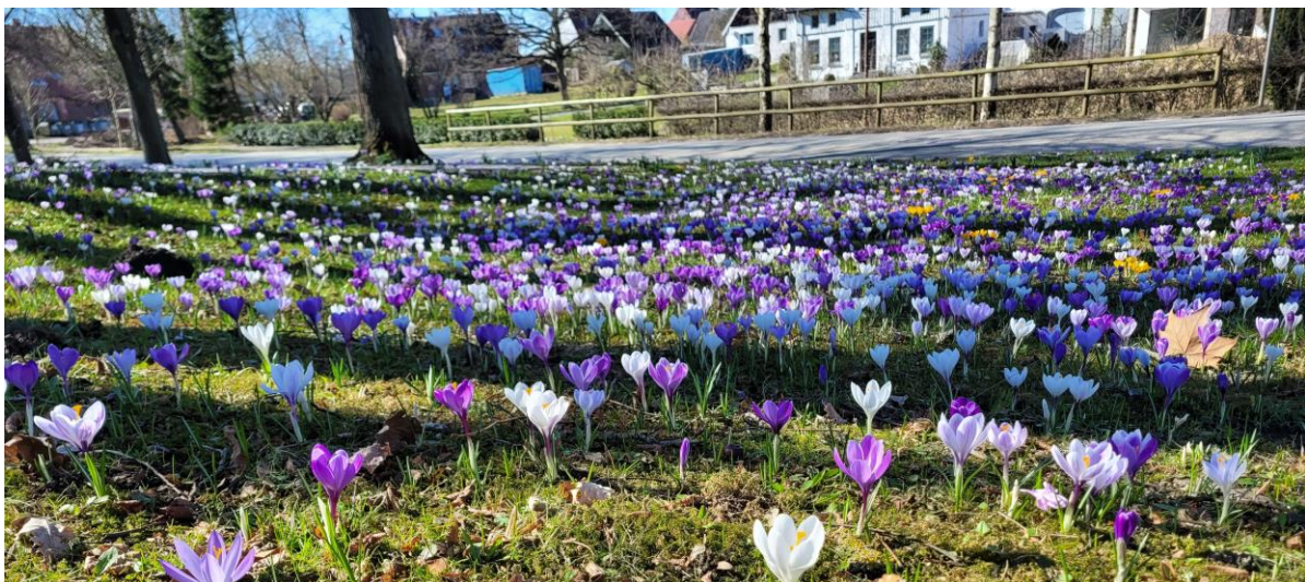
Curauer Dorfanger im März 2026

Nachpflanzungen außerhalb vom Stadtgebiet haben nur bei der Betrachtung einer Gesamtökobilanz für Schleswig-Holstein Bedeutung. Sie bewirken aber keinerlei Kompensation für das innerstädtische Klima, für die Luft-, Wohn- und Naherholungsqualität in unserer Stadt. Die Folgen sind für uns fatal, wenn die Bürgerinnen und Bürger Bad Schwartaus die langfristigen Umweltschäden aus den Tennet-Baumaßnahmen und Bahnbau bekommen und Bürger in anderen Kommunen dafür dauerhaft eine schönere Umwelt erhalten.