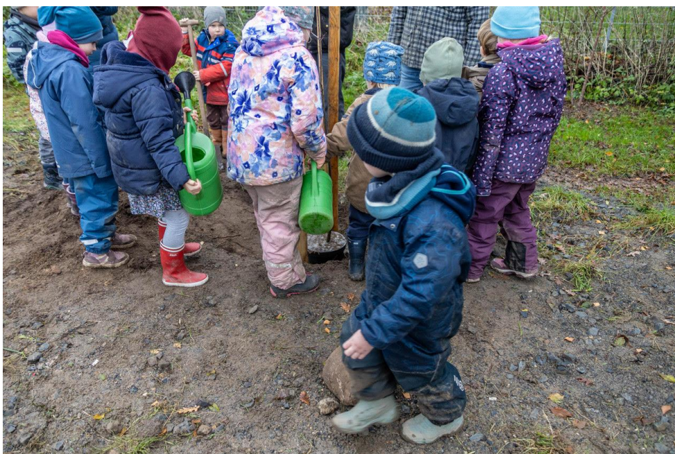
Eine Kindergruppe der Kita Papenmoor pflanzt „Baum des Jahres 2025“.

Es fehlt nur noch ein halbes Jahr für „ 40 Jahre Umweltbeirat “. Die städtische Satzung für den UWB formuliert seine Aufgaben kurz und klar: „ Der Umweltbeirat vertritt die Belange der Umwelt im Stadtgebiet. “ Umweltschutz im Stadtgebiet ist ein sehr umfangreiches und anspruchsvolles Tätigkeitsfeld. Es umfasst z. B. Umweltfragen zum Tier- und Artenschutz, zum Stadtgrün, zum Straßen- und Fahrradverkehr, zur Luftqualität, zum Lärm- und Klimaschutz oder zur Thematik Umweltinformation. In jüngster Zeit werfen die Planungen der DB zum Ausbau der Bahnhinterland-Anbindung besonders viele Umweltfragen auf. Geplante Waldrodungen mitten in unserer Stadt sind nicht nur heftige Grünverluste, sondern sie führen zu langfristigen Schädigungen und Belastungen für die Luft-, Klima- und Wohnqualität in unserer Stadt. Im Hinblick auf einen dauerhaften Umweltschutz in unserer Stadt sind daher Einsatz und Unterstützung durch ganz viele Akteure auch außerhalb des Umweltbeirats erforderlich. Ein wunderschönes Beispiel für Engagement zum Umweltschutz in unserer Stadt lieferte jüngst eine Kindergruppe von der Kita Papenmoor: