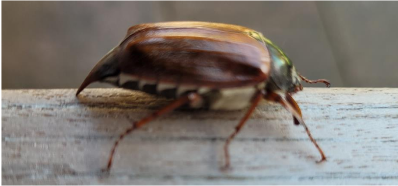
14.4. Maikäfer in Bad Schwartau

Frühjahr startet mit erstem Maikäfer: Ein Mitglied des Umweltbeirats fand bereits am 14.4. einen Maikäfer. Zeugnis für die Beliebtheit der Maikäfer (nicht nur der Schokoladenkäfer) sind das Kinderlied „Maikäfer flieg“ oder die Geschichte vom 5. Streich bei Max und Moritz von Wilhelm Busch. Maikäfer haben von der Paarung und Eiablage bis zum ersten Flug eine vierjährige Entwicklungsphase. Während vor 40 – 50 Jahren die Maikäfer noch häufig auftraten, sind sie heute schon selten geworden. Sogar Reinhard Mey singt: „ Es gibt keine Maikäfer mehr “.