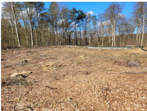
Kahlschlag im Riesebusch