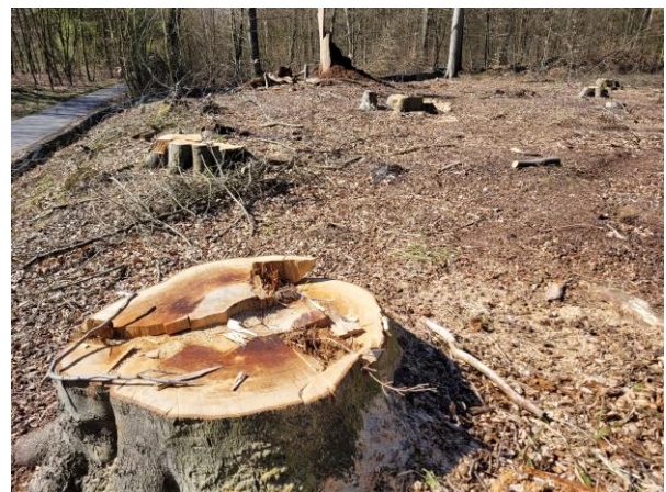
Dort standen 150 bis 200 Jahre alte Eichen + Buchen

NO2-Messung 2025 startet: Nachdem das Land S-H vor einigen Jahren die Messungen zur Luftqualität in unserer Stadt eingestellt hatte, führt der UWB jeweils im Frühjahr eine Messung zur Luftqualität an verschiedenen Stellen im Stadtgebiet (u. a. im Umfeld von Schulen) durch. Die Messungen starten nach Ostern. Über die Ergebnisse wird der UWB berichten.